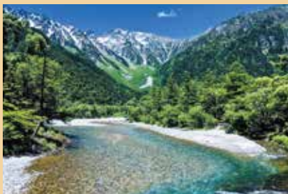
上高地は梓川上流にある景勝地(松本市)