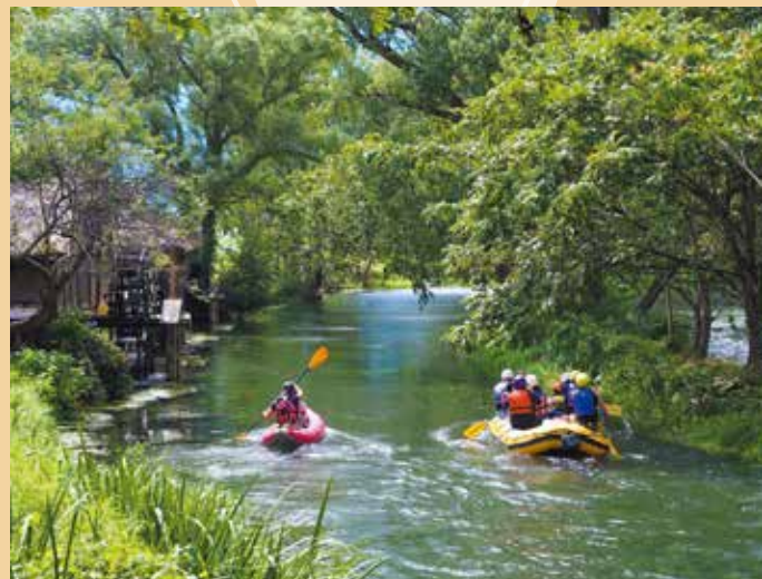
豊富な湧水がありワサビの栽培が盛ん(安曇野市)