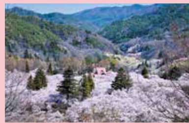
春、満開の桜に囲まれた高遠城址公園(伊那市)