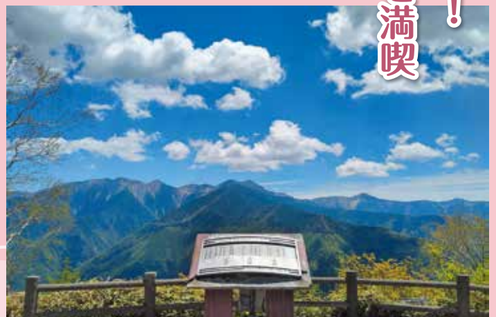
しらびそ高原は、南アルプスに加え、北アルプス・中央アルプスまで望めるためアルプス展望台と言われています。(飯田市)