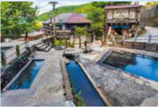
13もの無料の共同浴場が点在(野沢温泉村)