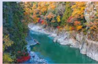
愛知県、静岡県を経て太平洋へ注ぐ天竜川