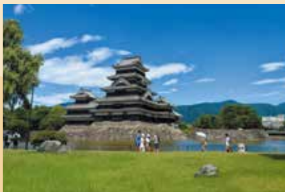
城下町の散策と合わせて楽しみたい松本城(松本市)

国宝「松本城」を有する松本盆地を入り口に、白馬や乗鞍、上高地など、国内屈指の山岳リゾートにアクセスできる中信ブロック。途中には「日本アルプスサラダ街道」が整備され、雄々しくそびえる北アルプスと裾野に広がるのどかな田園風景を楽しめます。古くは「塩の道」と呼ばれる交易路がこのエリアを通り、日本海から太平洋へ、塩や海の物が運ばれていました。