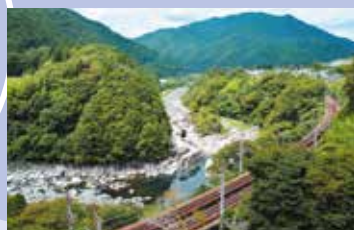
浦島太郎伝説が残る寝覚の床(上松町)

標高3000m級の山々が連なる中央アルプスと南アルプスを望む南信ブロック。県内ではめずらしい温暖な気候に恵まれ、豊かな土壌に農作物や花々が育つ自然豊かなエリアです。日本の星空と名高い「阿智村」や「昼神温泉」、川下りなどアクティビティが盛んな「天竜川」、春は「高遠の桜」など見どころ満載。飯田市にはリニア中央新幹線の開設も決まり、さらなる盛り上がり期待されます。