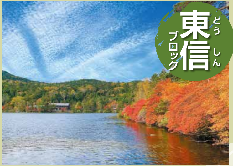
北八ヶ岳の広大な原生林の中に佇む、神秘的な白駒池(佐久穂町)

真田氏によって築かれた「上田城」を中心に広がる上田盆地と、浅間山の裾野に広がる佐久盆地。東信ブロックは、この2箇所を中心に構成されるエリアです。間をつなぐ「浅間サンライン」や中南信ブロックに抜ける「ビーナスライン」は絶景のドライブコース。途中に「軽井沢」や「美ヶ原高原」などの観光地があり、江戸時代には中山道と北国街道が通っていた歴史もあります。