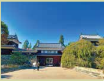
桜の名所としても人気を集める上田城(上田市)