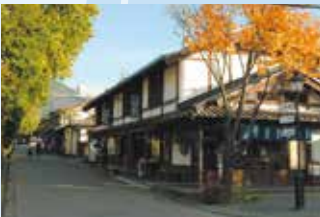
古いものと新しいものが調和した観光地(小布施町)