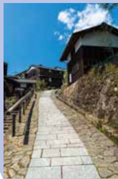
江戸時代の参勤交代で多くの人が行き交った、中山道43番目の宿場町(馬籠宿)

R19沿いに観光スポットが点在する木曾ブロック。江戸時代に整備された五街道のひとつ「中山道」が通るエリアで、全部で69ある宿場町のうち、贄川宿(にえかわじゅく)から馬籠宿(まごめじゅく)まで11の宿が木曾路にあります。道に沿って流れる木曾川は、奇岩や深淵を呈する「寝覚めの床」やエメラルドグリーンに輝く「阿寺溪谷」など景勝地の宝庫です。