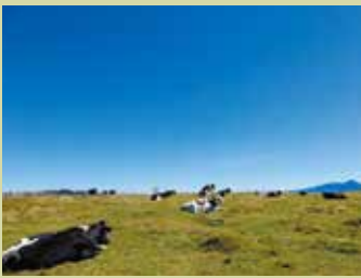
標高1500mにある暑さ知らずの別天地。(美ヶ原)

真田氏によって築かれた「上田城」を中心に広がる上田盆地と、浅間山の裾野に広がる佐久盆地。東信ブロックは、この2箇所を中心に構成されるエリアです。間をつなぐ「浅間サンライン」や中南信ブロックに抜ける「ビーナスライン」は絶景のドライブコース。途中に「軽井沢」や「美ヶ原高原」などの観光地があり、江戸時代には中山道と北国街道が通っていた歴史もあります。