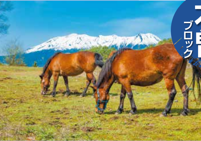
御嶽山の麓に広がる木曾馬のふるさと、開田高原(木曾町)